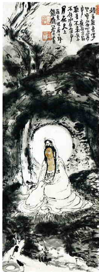
普陀落山觀世音菩薩像