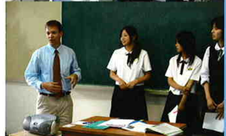
中学3年生 英会話授業より