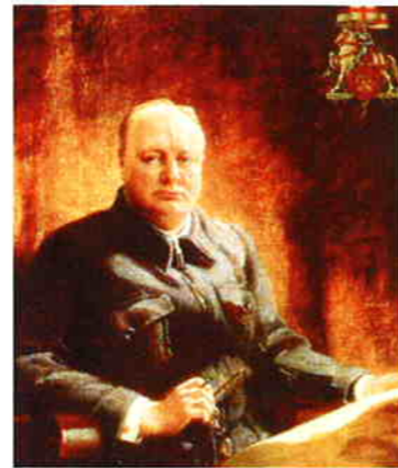
He is one of the graduates from Harrow. (ウインストン・チャーチルも卒業生)