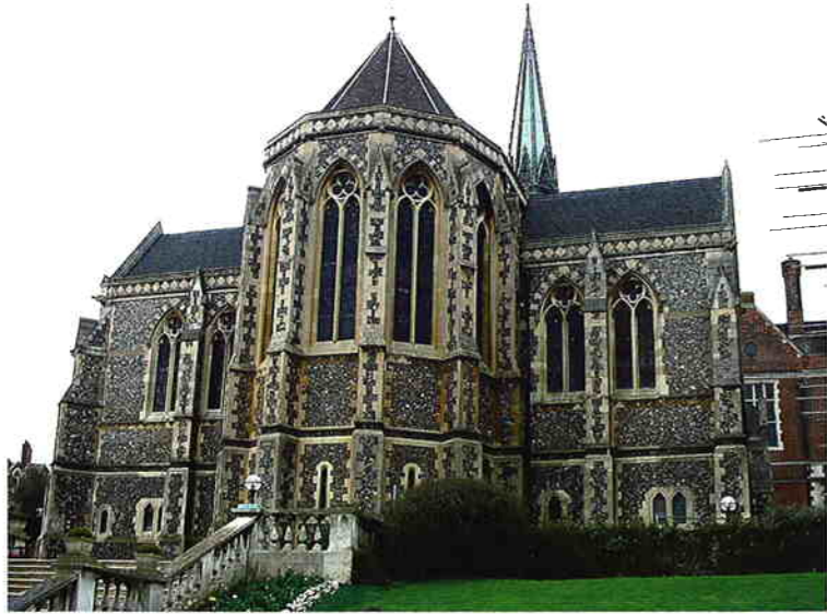
Harrow School (Chapel)

ハロウ校(映画ハリーポッターの撮影場所として一躍有名になった学校)は今から約430年以上前に大英帝国の礎を築いたエリザベス1世の勅許を受けて創設された私立の名門校です。