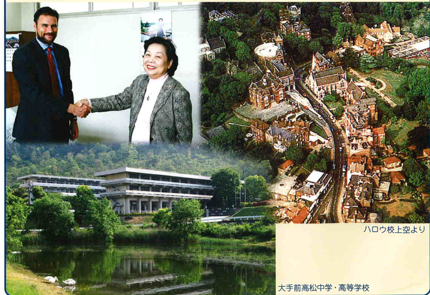
ハロウ校上空より