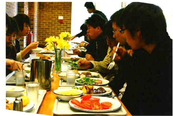
ハリーポッターのような寮生活