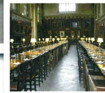
みなさんはどのシーンか わかりますか。